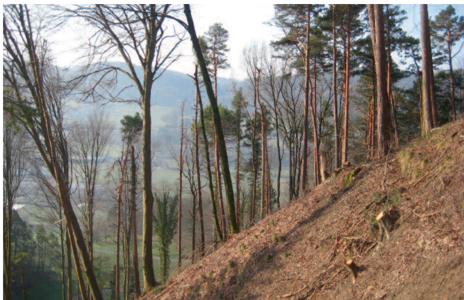
Der Waldteufel ( Erebia aethiops ) profitiert von den Waldauflichtungen im Stocketholz/Dättlikon